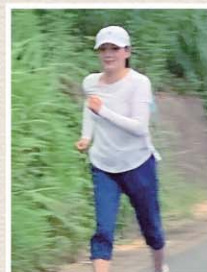
健康維持とエコのためランニング(目標はハーフマラソン完走!)と自転車通勤等の実践中です。立ち止まってお話をする機会が増えました^^