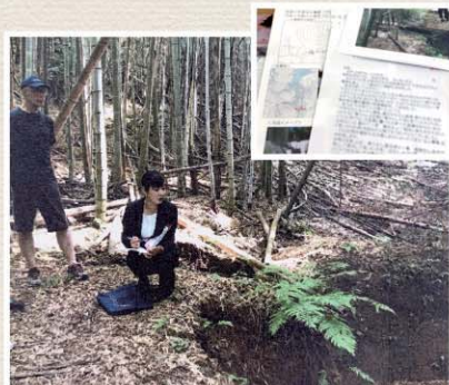
大雨、台風によって何度も土砂流出してきた地域の治山事業(治山ダム)がはじまります。今後も、現地確認、おうかがいいたします！