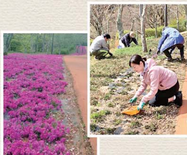
有志の皆さんと草抜きに参加@共楽公園 満開の芝桜 地域が元気に 子どもたちの思い出に想いを乗せて