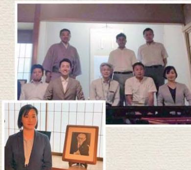
志を磨くため同志と定期的な勉強会で学んでいます@PHP研究所 尊敬する松下幸之助翁ゆかりの部屋にて