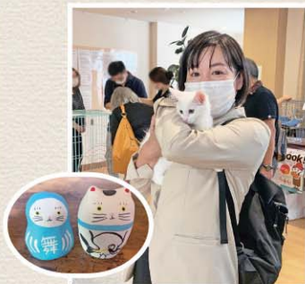
舞鶴では初めてとなる猫譲渡会 @中舞鶴(7/18)に伺いました。動物愛護に取り組んでまいります。