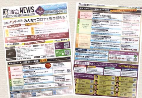
「みんなでコロナを乗り越える！」支援策を分かりやすくお伝えするニュースをいち早く発行(5月)