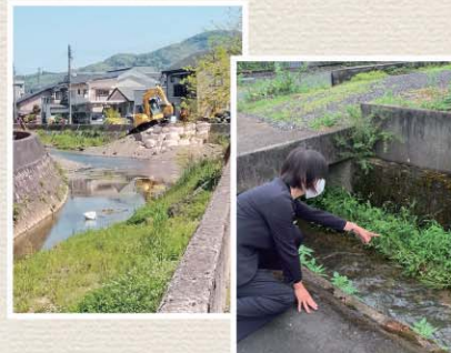
近年の度重なる水害対策として河川の浚渫(川床の掘削)の要望が多いです。安心安全のため現場を見て、細やかに取り組んでまいります。