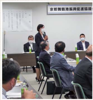
京都府舞鶴港振興促進協議会設立総会にて港で発展するまち舞鶴ホットハートで取り組みます(7月7日)